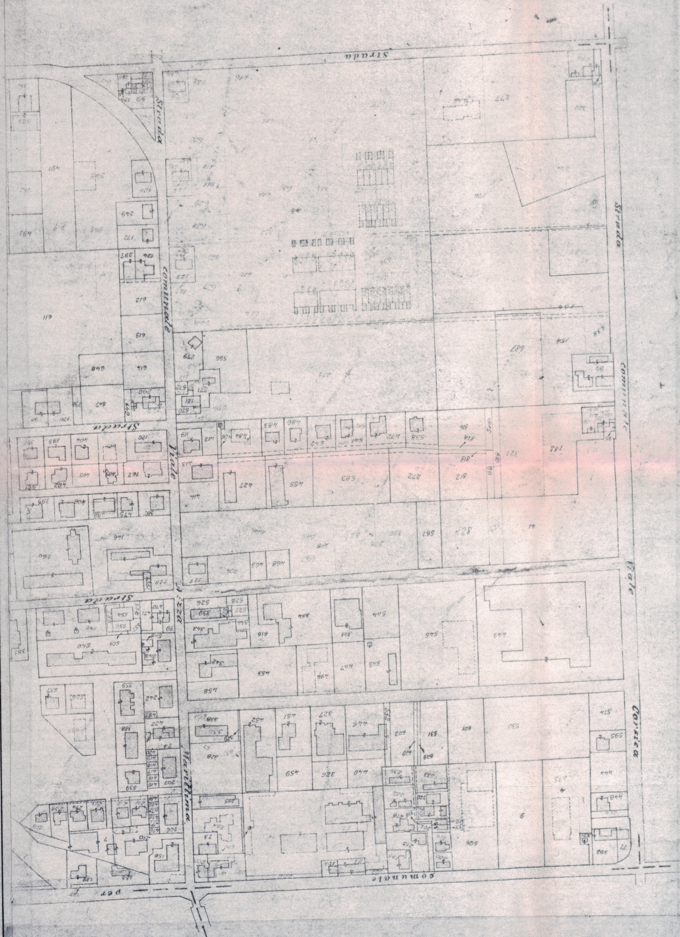
estratto autentico di mappa scala 1:2000

L'ATTRIBUZIONE DEI REDDITI VERBA EFFETTUATA IN SEDE DI REG. PRODOMINICA